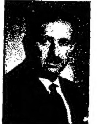
السيد محمد بن عبد العزيز آل سعود ملك العربية السعودية

عمان - يتقبل جلالة الملك المعظم صباح غد ( السبت ) أرواق اعتماد السيد أحمد الشارف قشوط سفير ليبيا في عمان . وكان السيد قشوط يشغل منصب القائم بالأعمال الليبي في عمان .